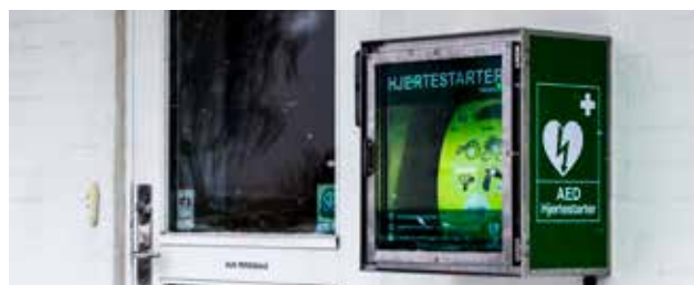
Der er opsat en HJERTESTARTER ved sognegården