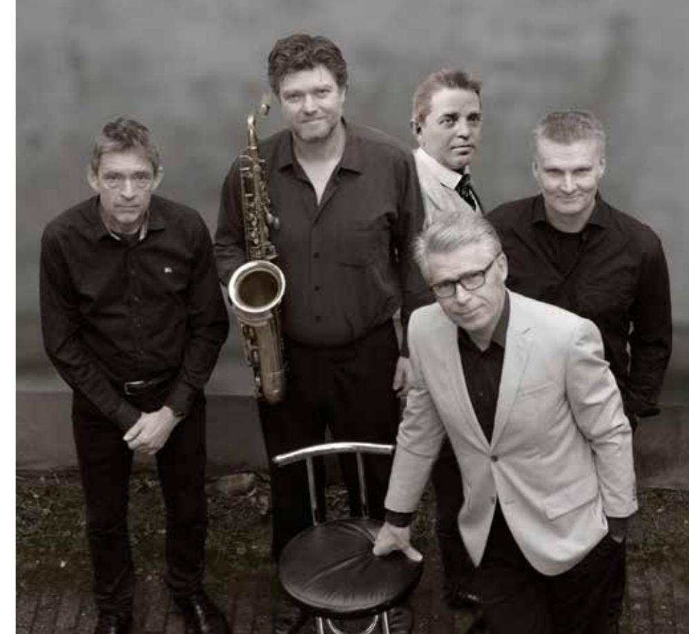
Festugekoncert - Carl i kirken