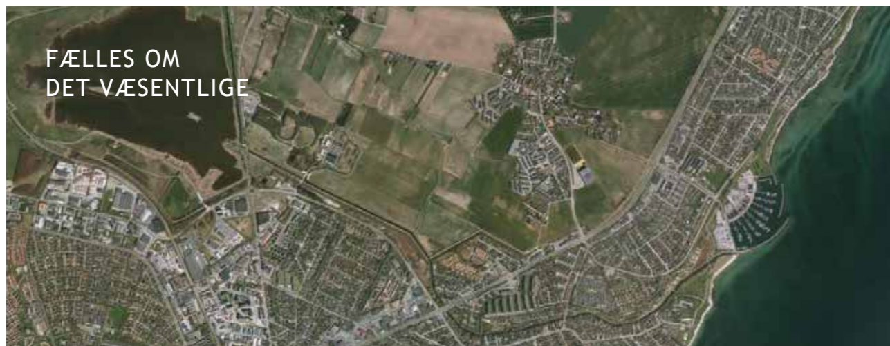
Luftfoto af Egå og omegn

Du er også velkommen til orienteringsmødet