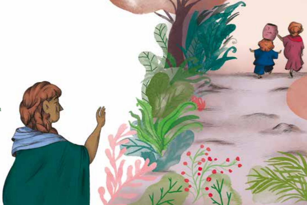
Sensommerfest for familier. Adam, Anna og hullet i taget. Illustration af: Josephine Kyhn

Vi begynder i kirken med et par dejlige sommersalmer og historien om Adam, Anna og hullet i taget. Derefter er der fælles aftensmad i sognegården og fuld gas på boderne uden for med flødebolle-maskine, dåsekast og ristning af skumfiduser. Så tag bedstemor, naboen eller din veninde under armen og kom til en hyggelig aften i fællesskabets tegn. Læs mere på side 20.